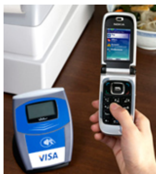
solution de paiement VISA

Visa, avec son entrée dans le capital de mTLD, propose une solution de paiement par mobile intégrant la gestion de compte à distance, le paiement entre particulier et l'achat en ligne : http://corporate.visa.com/av/nl/mobile_platform0207.html